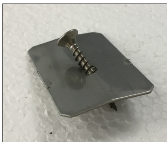
Festeskive (t=1mm) 36x55 mm, Skruer 5x35